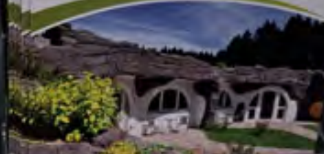
NATUR UND PHANTASIE