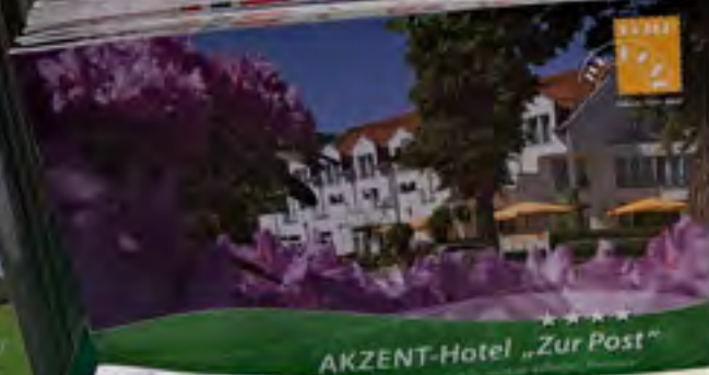
AKZENT-Hotel „Zur Post“